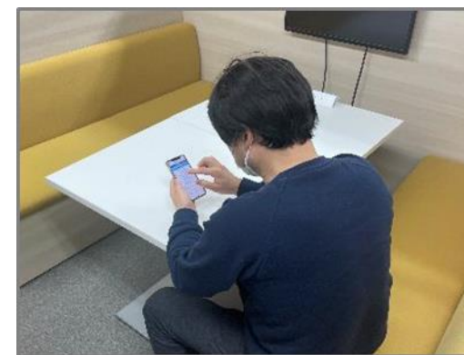
ツールを操作している 利用者の様子