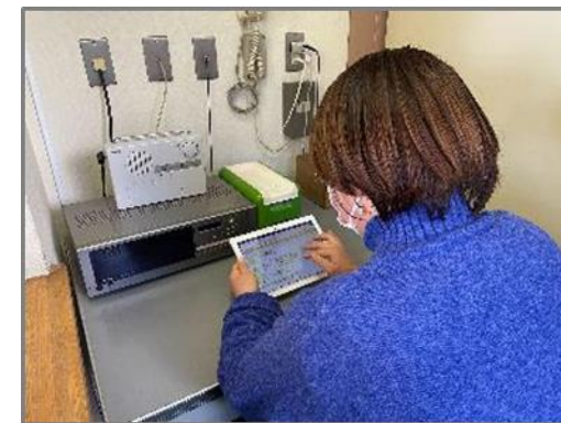
ツールを操作している 会館管理人の様子

担当課（地域防災課）が問合せ窓口となり、操作方法がわからない利用者にも可能となる環境を準備