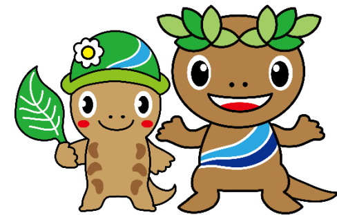
森っこサンちゃん